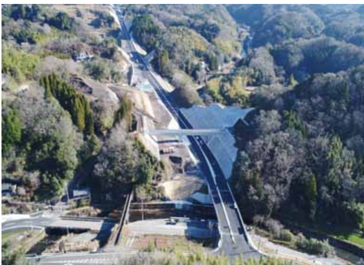
1月19日に竹田 ICまで開通。これから阿蘇までの事業を早く起こさなければなりません。市民の願いを一つにして、声を上げていきましょう。