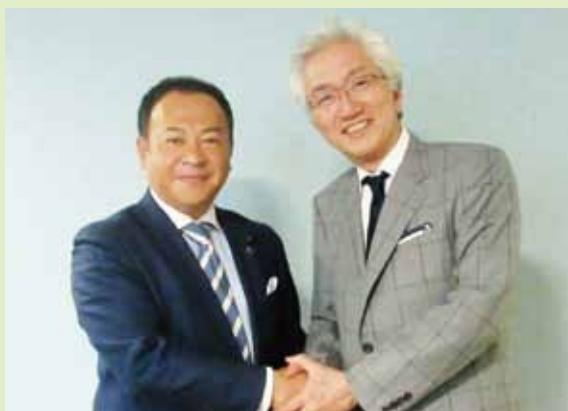
京都府出身の西田昌司参議院議員も、過疎高齢化に頭を悩ましています。その課題に対応するため、どうすべきかを協議。ご指導いただきながら、大分県版も考察しました。