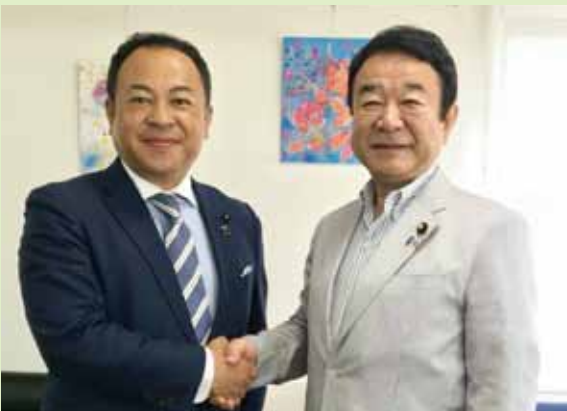
青山繁晴参議院議員は地方の活性化について、熱く持論を説かれます。確かに、地域コミュニティの再構築こそ、喫緊の課題かもしれません。人々がどこに向かって暮らすのが大事です。