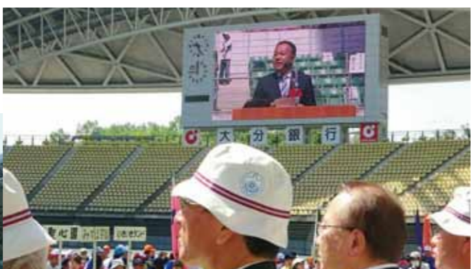
大分県の障がい者スポーツの祭典、大分県ゆうあいスポーツ大会。皆さん、力の限りを出して競い合います。しかし、その後は勝った人も負けた人も笑顔でお話。楽しいです。