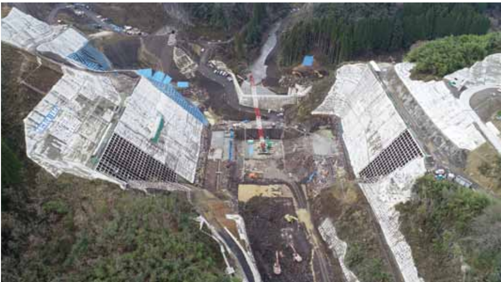
尊いいのちと財産を奪う玉来川の氾濫。市民の安心安全を守る玉来ダム建設も、本体コンクリート打設に入りました。2020年度に治水効果が発現できるよう工事を急ぎます。