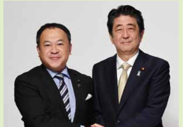
4月に訪問した時には、地方創生について熱弁された安倍晋三総理大臣。7月に再訪した時には姫だるまを手渡し、竹田市の願いを伝達。「応援します」とエールをいただきました。