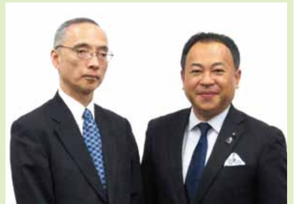
太田充財務省主計局長とは理財局長の頃も含めて、平成30年は4回も面談して要望を伝えました。どの事業でも、予算をどうするかは大きな問題。粘り強いいきます。