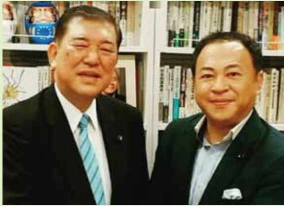
「地域づくりの成功事例を集め、参考にすることが大事」と、大臣として地方創生に奔走された石破茂衆議院議員。具体的な事例を示しながら、ご指導いただきました。