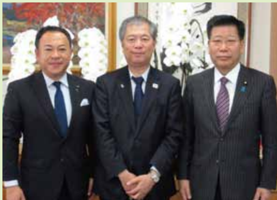
衛藤晟一参議院議員からのご紹介で、藤原誠文部科学事務次官に要望を伝えました。大分県の現状と改善点を提示して、事務方職員も一緒に議論。また、お願いします。