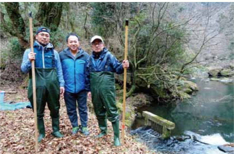
12月20日に音無井路の大谷川第一水門が制御不能というので、月に一回の清掃点検作業に同行して確認。対応を考えます。

本県の畑地かんがい施設は整備後、長い年月が経ち、老朽化が著しく進んでいる。そのため、パイプラインの破裂などの突発事故が多発。その数は、過去3カ年平均で年およそ100カ所。事故対応工事費は、平均40万円。ところが、これを支援する補助制度がない。足腰の強い園芸産地を維持・発展させるために、基幹水利施設の小規模な突発事故に迅速に対応できるように補助制度を創設してもらいたい。