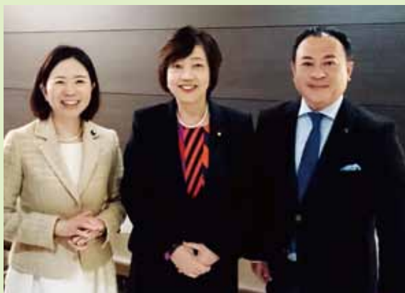
太田房江参議院議員と自見はなこ参議院議員。女性の活躍と、保育と教育の話をし、日本の状況を変えていかなければならないとの共通認識に至りました。頑張ります。