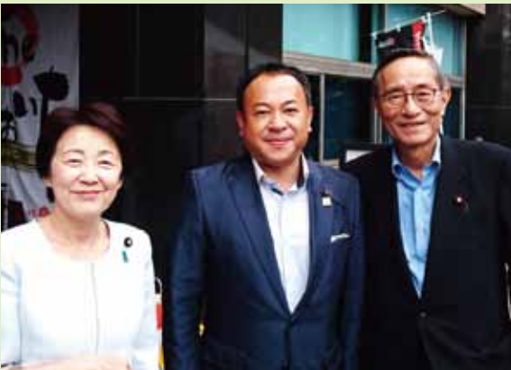
自由民主党本部で開催された大分県フェア。災害からの復旧・復興を願い、山の幸、海の幸を販売。細田博之衆議院議員、山谷えり子参議院議員からも協力をいただきました。