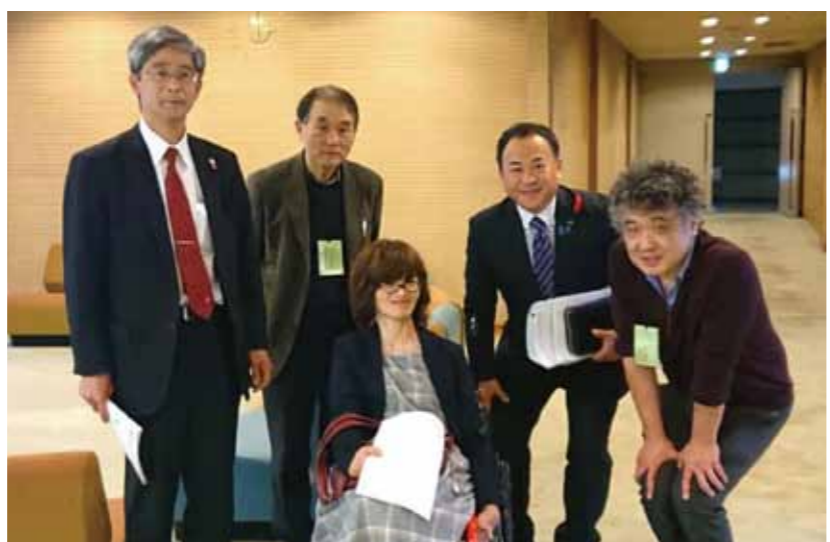
特別委員会が開会される度に傍聴されていた「誰もが安心して暮らせる大分県をつくる会」の皆さん。特別委員会は解散しましたが、引き続き活動していきます。

員会でした。調査を進めるうちに、障がい者差別の相談窓口の不備や、県教育委員会での障がい者雇用の実態が明らかになるなど、行政が改善しなければならぬことが多く出てきました。