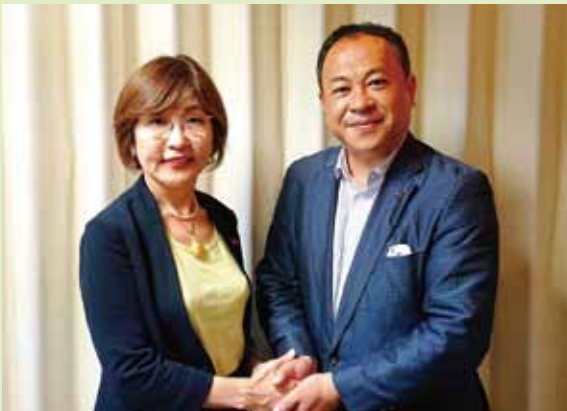
稲田朋美衆議院議員には、政務調査会会長時代からご指導をいただいています。「苦しんだからこそ、苦しみがわかる」と、福祉分野もご教示くださります。感謝します。