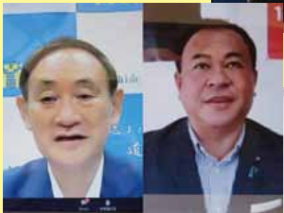
菅官房長官(当時)と遠隔での対談。「地方に軸足を置いて国づくりを考えて」と強く要望。(9月11日)