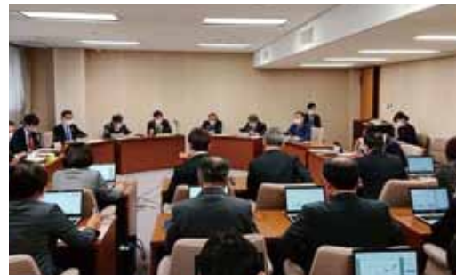
タブレット、パソコンを使って行う商工労働企業委員会