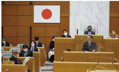
本会議では、議員提出議案の説明