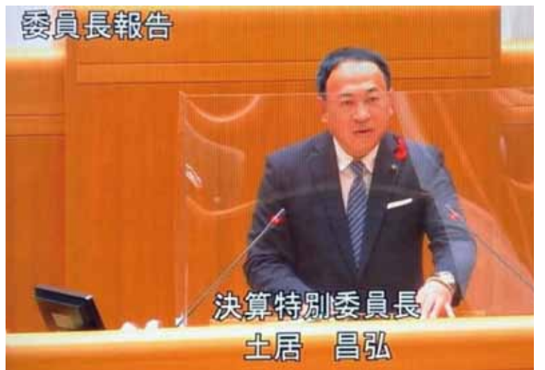
本会議は、インターネット中継されます。県議会を様々な手段でお伝えしています。

特に、熱い議論となったのが、財政運営の健全化についてです。本県では「行財政改革アクションプラン」に基づいて行財政改革に取り組んだ結果、財政調整用基金残高は目標額を26億円上回る350億円余となるなど、財政の健全化に一定の効果を上げていま