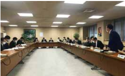
ホーバー議案の説明を受ける自由民主党会派